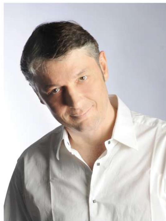
審査員 エマニュエル・シュトロッセ(ピアノ)

今回は、高校、大学生を対象とした1月13日マスタークラス、14日ピアノ・リサイタル、15日音楽コンクール本選と、シュトロッセのピアノズムを十分に感じていただける3日間になります。